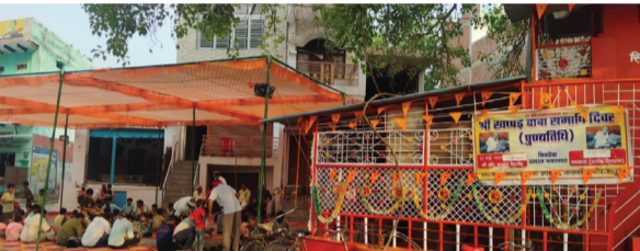
समाचार भारत गुड्ड सिंह

श्रद्धा और भक्ति के साथ मनाया गया खप्पड़ बाबा का समाधि दिवस, विशाल भंडारे में उमड़े श्रद्धालु